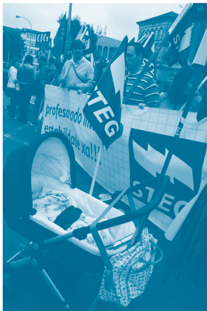
Concentración a prol da estabilidade do profesorado interino e contra a redución de prazas. Mércores 17 de setembro.

Seguiremos a esixir unha dotación de profesorado adaptada á realidade dun ensino galego de calidade e unha solución ao profesorado que presta servizos a esta Consellería. De non ser así verémonos na obriga de continuar coas mobilizacións que consideremos oportunas